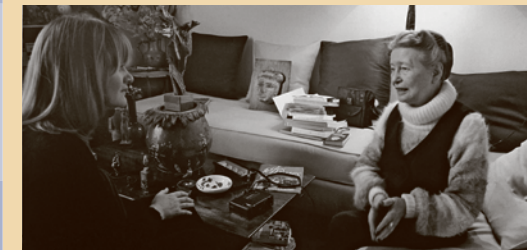
Alice Schwarzer (links) im Gespräch mit Simone de Beauvoir 1973

20.00 Alice Schwarzer präsentiert: Simone de Beauvoir live. 6 Bernhard-Theater, Falkenstr. 1, 8008 Zürich.